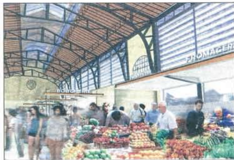
Un restaurant sera installé en mezzanine à l'intérieur de la halle.

Les travaux : - Phase 1 : fonctionnement transitoire (transfert des étaliers et des producteurs locaux) : 8 mois. - Phase 2 : déconstruction des ouvrages existants : 3 mois. - Phase 3 : reconstruction de la cité marchande : 15 mois dont un mois de préparation.